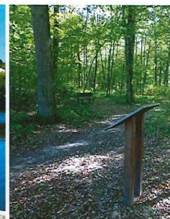
La forêt, sujet de découvertes...