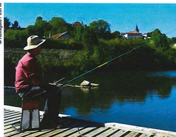
Pêche sur le Madon