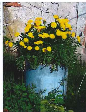
Au détour du chemin...