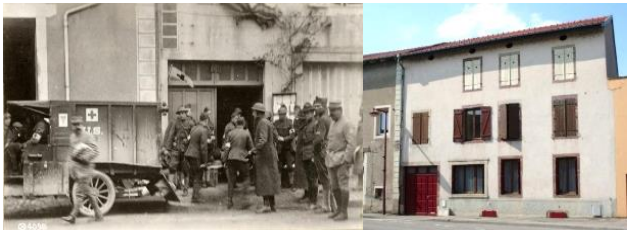
1 - Einville-au-Jard. Hôpital américain de campagne, 20 Grande Rue, hier et aujourd'hui.