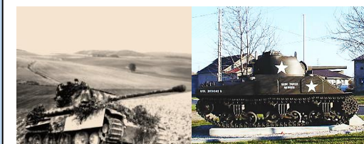
6 - Arracourt. Un Panther de la bataille de chars d'Arracourt, septembre 1944. Le Sherman sur la place du village.