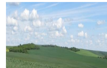
4 - Bures. Versant Sud de la colline du Haut des Ruelles où les soldats américains ont pris position en octobre 1917 et là où s'est déroulée la bataille de chars d'Arracourt en septembre 1944. Vue depuis la route qui va de Bathelémont à Bures.