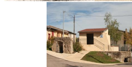
3 - Bathelémont. La batterie du premier coup de canon. Monument des trois premiers soldats américains morts au combat. Blockhaus et hall d'exposition au centre du village.

Circuit de la mémoire (29 km A.R.). Einville-au-Jard (1), Valhey (2), Bathelémont(3), Bures (4), Réchicourt-la-petite (5), Arracourt (6). Monument : *