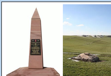
5 - Réchicourt-la-Petite. Monument sur la colline du Haut-des-Ruelles, à l'endroit où sont morts les premiers soldats américains. Dômes de blockhaus allemands dans les champs.