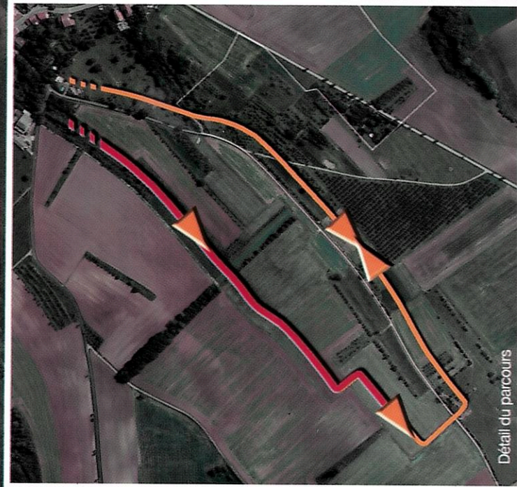
Détail du parcours

Itinéraire principal Itinéraire déconseillé pour les personnes à mobilité réduite