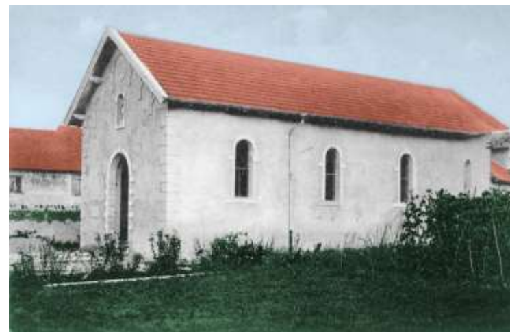
La chapelle de 1922