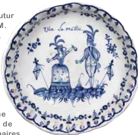
Plat, décor à l'élegante et au garde national. Aire-sur-la-Lys, vers 1789-1791