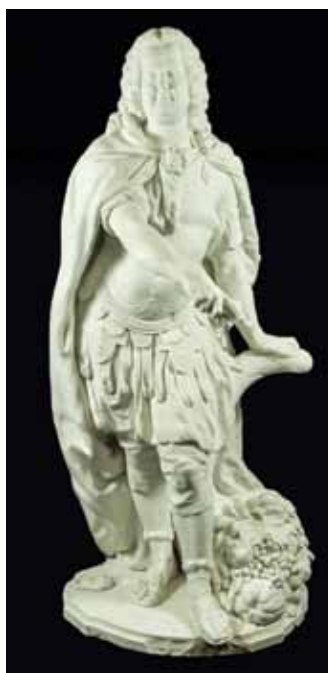
Stanislas en costume romain Cylindré à Lunéville, 1770

Cette exposition présente un ensemble remarquable de statuettes lorraines en biscuit de céramique des XVIII e et XIX e siècles appartenant aux collections du palais des ducs de Lorraine - musée de Nancy. Crieurs des rues, scènes galantes, amours des dieux, portraits témoignent du travail virtuose des manufactures lorraines au temps du roi Stanislas.