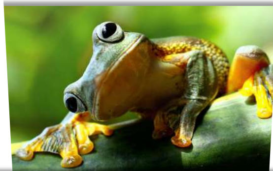
Création : G. Tack - Ne pas jeter sur la voie publique.

Période d'ouverture : du 13 avril au 31 octobre 2019