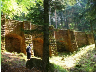
Ce vieux pont allemands ne figure pas sur les cartes, même s'il est en très bon état. Vous pouvez descendre pour regarder l'inscription.