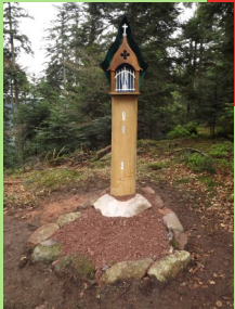
Vierge du Trupt, est entourée d'une végétation éclatante.