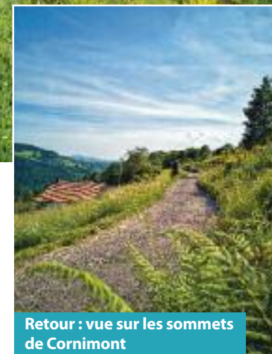
Retour : vue sur les sommets de Cornimont