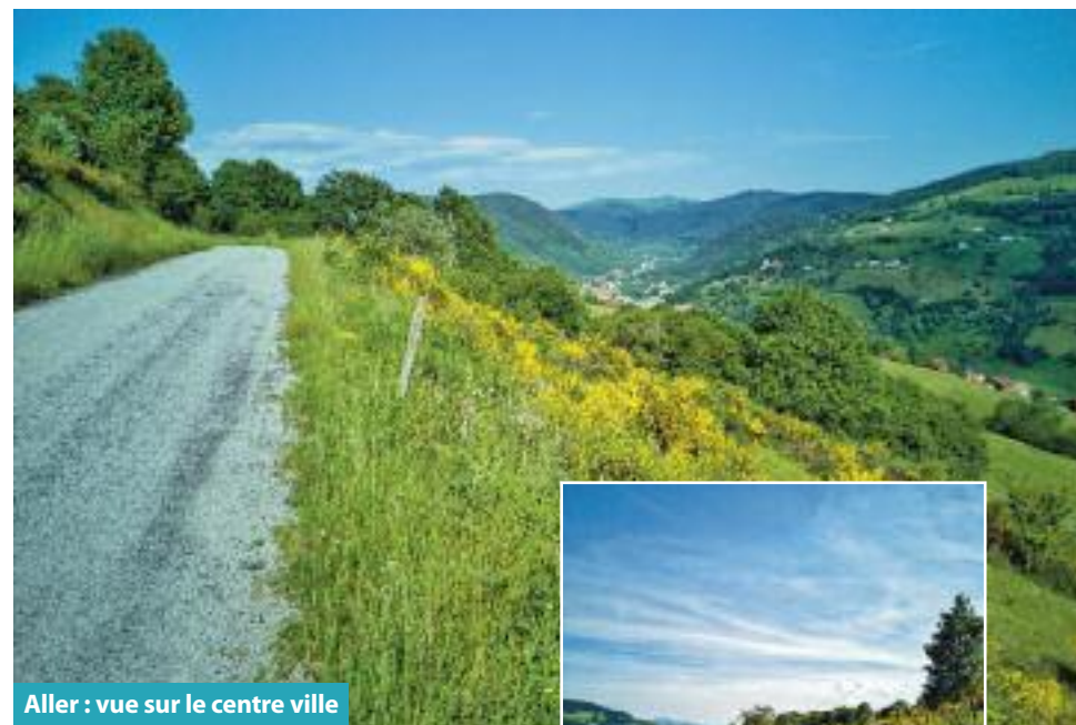
Aller : vue sur le centre ville

Le versant abrupt derrière l'auberge du Couchetat servait autrefois de « lançoir » : technique utilisée par les bûcherons de l'époque qui faisaient glisser les grumes de sapin dans la pente jusqu'à un chemin carrossable, d'où elles étaient ensuite chargées sur des charrettes à bœufs ou à chevaux.