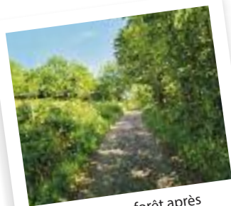
Passage en forêt après l'ancienne école