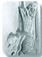
Crucifix XVe s.