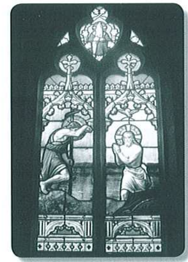
Vitrail de la baptistère

Ancienne chapelle de la famille Bayer de Boppard, adjonction du milieu du XVe s. Croisées d'ogives interpénétrées avec quatre écus aux intersections. Vitrail de Maréchal (1850).