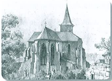
Chevet de la Collégiale par Migette en 1867

D'un style gothique des XIIIe et XIVe siècles, l'église présente un aspect assez massif et trapu. L'édifice est construit en pierres de grès rose-ocre d'un bel appareil régulier, sauf au transept nord recouvert d'un enduit. L'ensemble est couvert d'ardoises.