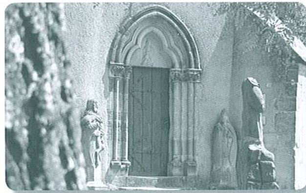
Portail de la chapelle

Deux statues de la suite des Saints Auxiliaires, Gilles et Erasme, encadrent le portail. Elles furent placées là au début du XXe siècle.