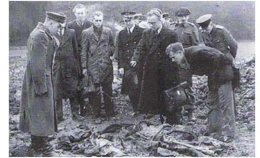
Ouverture du charnier – Photo R. Féry

En novembre 1945, en présence des autorités civiles et militaires françaises et soviétiques, on procède à des sondages dans les fosses avant de répercuter à la une de quatre quotidiens régionaux les gros titres qui figurent sur la couverture de ce document.