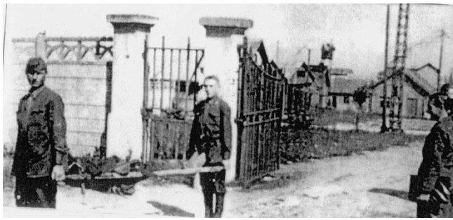
L'absence de nourriture, les épidémies, la promiscuité, le manque de soins vont entraîner une mortalité très élevée. Est Photo

Spectacle de désolation souvent évoqué par les témoins : ces cortèges de morts-vivants rallient à pied le camp du Ban Saint-Jean (5 km). Les plus faibles sont immédiatement dirigés vers le pseudo-hôpital de campagne de Boulay (3600 victimes reposent dans une partie de l'ancien cimetière israélite profané et réquisitionné). Les autres sont parqués au Ban Saint-Jean qui verra transiter de 1941 à 1944 plus de 300 000 prisonniers soviétiques avant dispersion vers les mines de fer ou de charbon. Mais les conditions d'acheminement, la pénibilité du travail et l'absence de nourriture vont entraîner une mortalité très élevée.