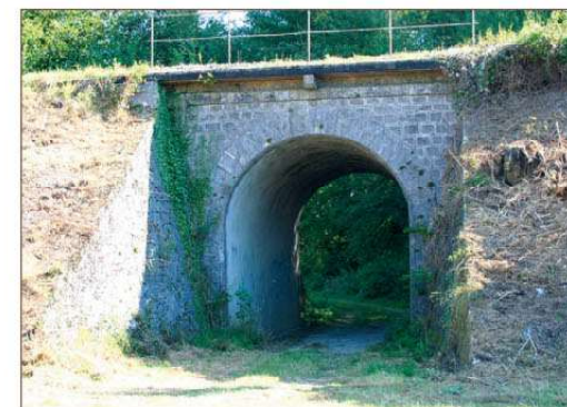
Pont des Vins

• Comité de la Meuse : https://meuse.ffrandonnee.fr/